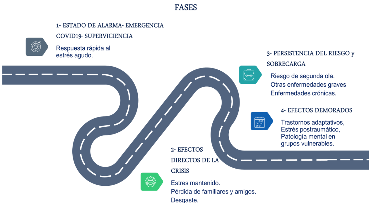
Gráfico 1. Fases de la emergencia sanitaria.

La emergencia sanitaria derivada del estado de alarma por la COVID19 ha puesto de manifiesto que todas las personas somos posibles afectadas y todas tenemos una responsabilidad que cumplir en las cuestiones relacionadas con la salud. Por ello, es importante implementar políticas de salud pública así como ofrecer una respuesta comunitaria coordinada y flexible que incorpore la participación activa de todos los grupos de la comunidad.